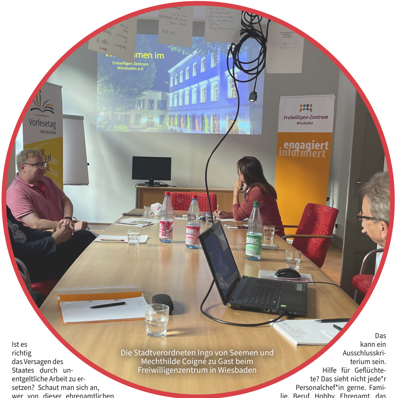
Die Stadtverordneten Ingo von Seemen und Mechthilde Coigné zu Gast beim Freiwilligenzentrum in Wiesbaden

Ist es richtig das Versagen des Staates durch unentgeltliche Arbeit zu ersetzen? Schaut man sich an, wer von dieser ehrenamtlichen Arbeit profitiert (nämlich alte, kranke, arme und schutzlose Menschen), dann muss die Antwort natürlich JA lauten.