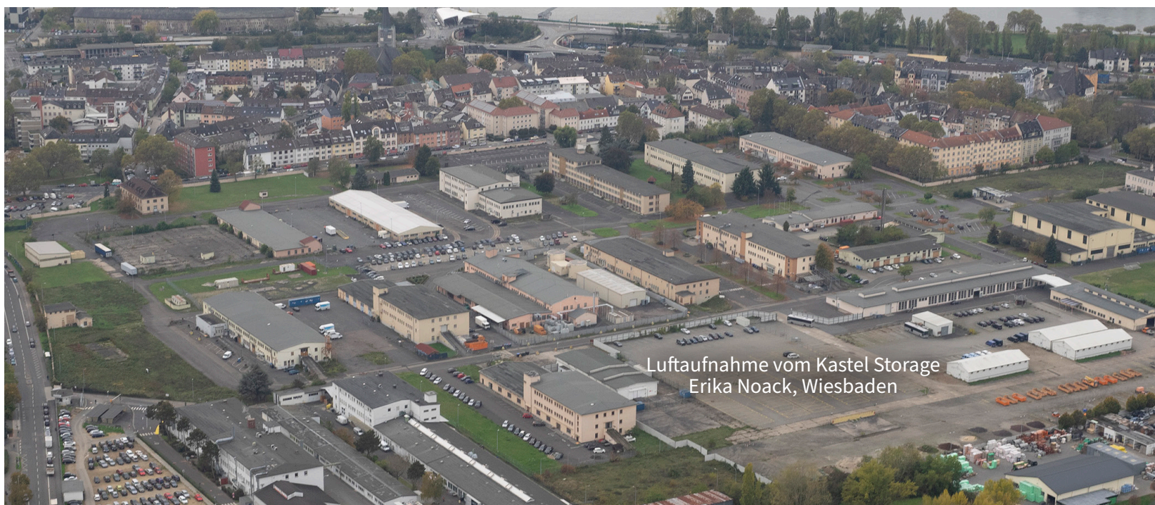
Luftaufnahme vom Kastel Storage

war in den zurückliegenden vier Wahlperioden Fraktionsvorsitzender. 1985 wurde er Ortsbeiratsmitglied in Mainz-Kastel, ist seit der letzten Kommunalwahl erneut Ortsvorsteher dieses Stadtteils und seit 8. Februar 2022 Mayor for Peace